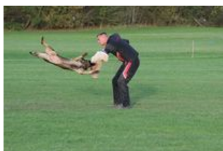
Hesselballe Cita ♀ 03.05.2013 DK 08820/2013 IPO 2, IPO 3, SPH 2...