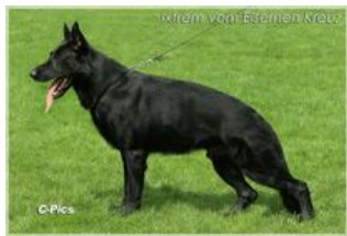
Ixtrem vom Eisernen... ♂ 21.08.2015 VDH/SZ 2317958 IPO 2